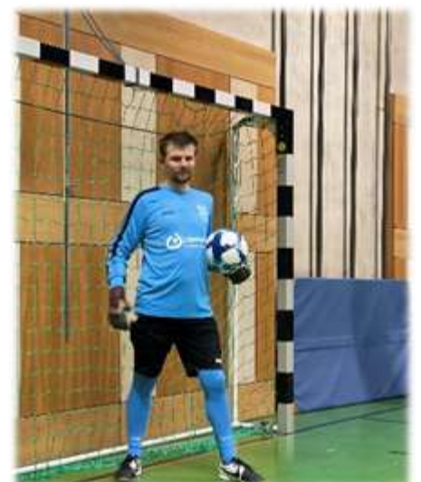
2. und 3. Torwart und Headcoach im neuen Gewand

Bericht: Joachim Strubel