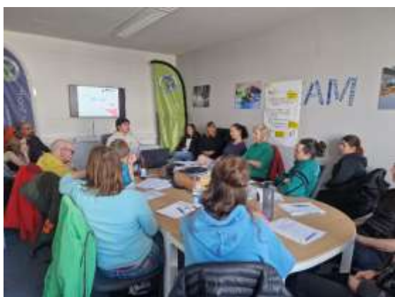
Prävention sexualisierter Gewalt (BTV) und