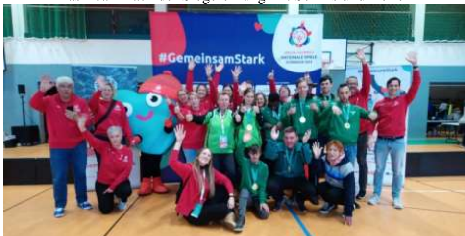
Bericht: Elfriede Rieger- Beyer

Das Team nach der Siegerehrung mit Schiris und Helfern